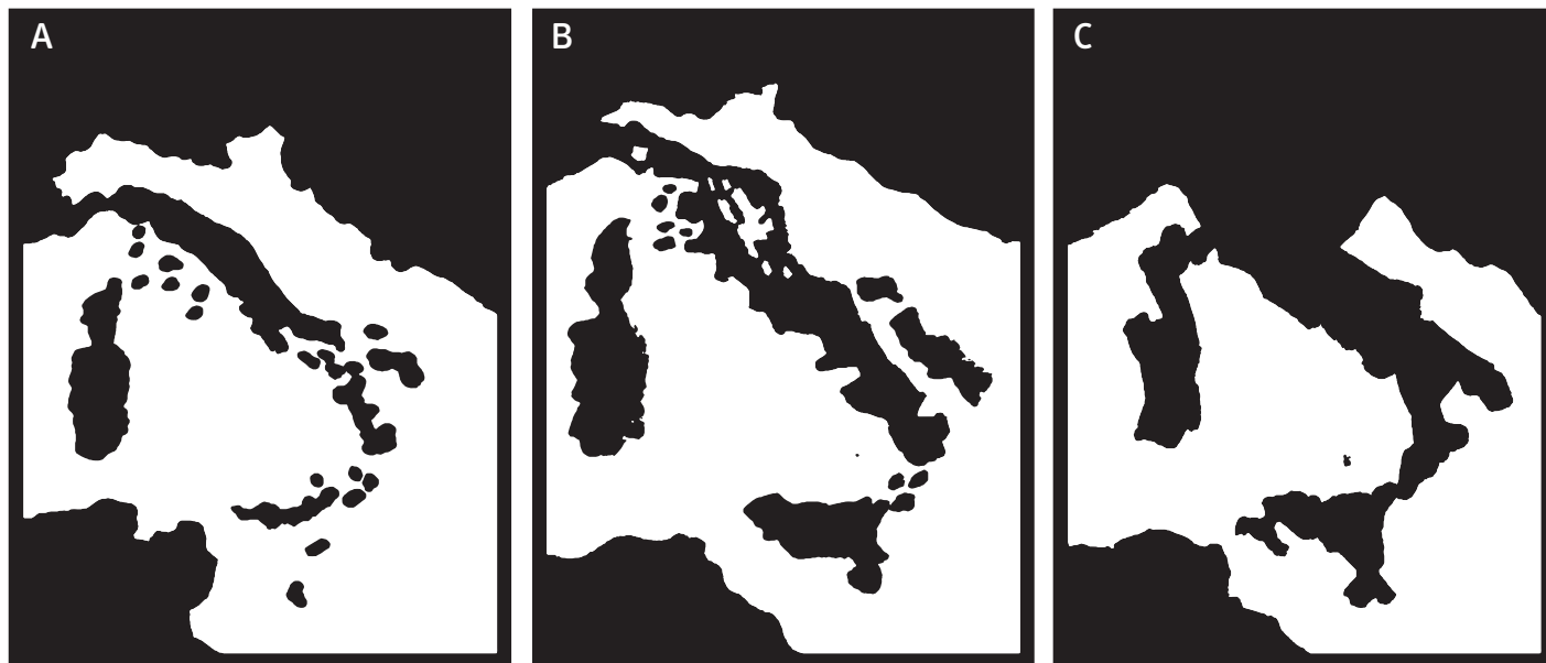
FIGURA 1. Ricostruzione delle fasi di formazione dell'Italia