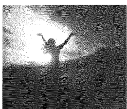
RIVESTITA DI BELLEZZA DIVINA La donna nel mistero di Dio

S. Guirarro, I detti di Gesù , Carocci Editore, Roma 2016, € 13