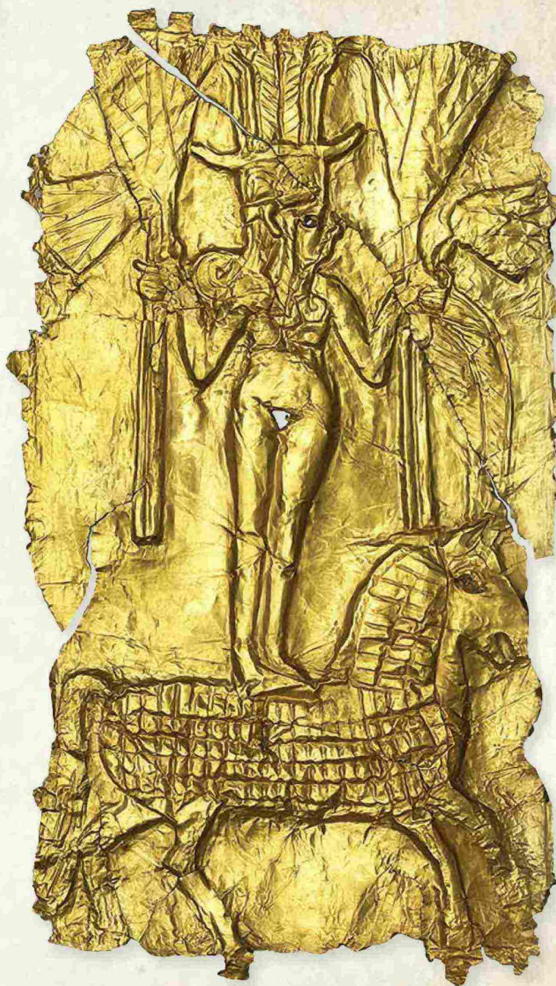
Placchetta in oro raffigurante una divinità femminile sul dorso di un cavallo al galoppo, da Lachish. XII sec. a.C. È possibile si tratti di una raffigurazione della dea Astarte.