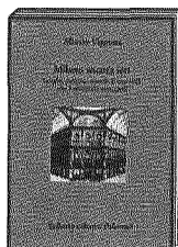
MILANO ANCORA IERI di Alberto Vigevani Sellerio

Sottotitolo: sesso, potere e politica nell'Italia del caso Montesi. L'autore è un professore inglese. Il libro è magnifico e delizioso dal punto di vista narrativo.