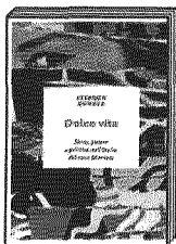
DOLCE VITA di Stephen Gundle Rizzoli

Sottotitolo: sesso, potere e politica nell'Italia del caso Montesi. L'autore è un professore inglese. Il libro è magnifico e delizioso dal punto di vista narrativo.