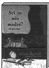
SEI TU MIA MADRE? di Alison Bechdel Rizzoli Lizard

Autrice da seicentomila copie di stile fintamente giovanile. Mi viene un dubbio orribile: e se fosse autenticamente giovanile? Se ragazzi e ragazze fossero davvero così?