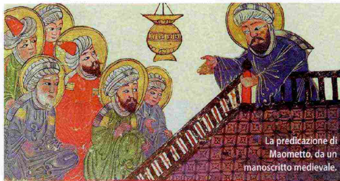
La predicazione di Maometto, da un manoscritto medievale.

Craig Whitlock, reporter del Washington Post e tre volte finalista al Premio Pulitzer, si addentra nel racconto del ventennale conflitto Stati Uniti-Afghanistan, costato oltre 2.300 miliardi di dollari e 24mila morti.