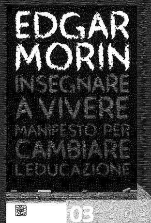
EDGARD MORIN, Cortina, Milano 2015

Pubblicazioni e ricerche sul mondo della formazione, dell'istruzione superiore e della ricerca. Per leggere le recensioni integrali, visitare la sezione 'Reviews' del sito rivistauniversitas.it