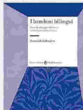
Paola Bonifacci I BAMBINI BILINGUI Carocci, 279 pag., 26 euro

Il libro analizza anche gli aspetti emotivi e il bilinguismo nei casi di adozione.