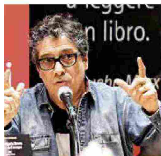
Lo scrittore Sandro Veronesi, premio Strega 2020 e autore di questo saggio dedicato a John Fante, edito da Carocci di cui qui proponiamo un estratto