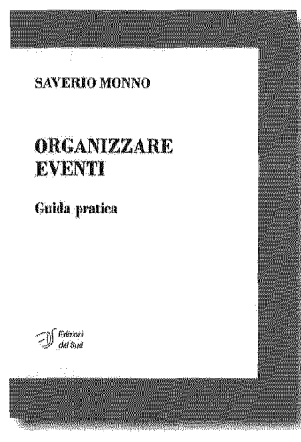
ORGANIZZARE GLI EVENTI. GUIDA PRATICA DI SAVERIO MONNO EDIZIONI DAL SUD, BARI 208 PP., 18 EURO

campo che ha obiettivi diversificati a seconda dello strumento che usa, del luogo e delle aspettative del committente, ma fondamentalmente svolge un ruolo di informazione, formazione e divertimento.